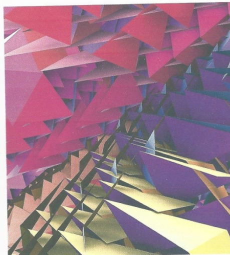
„Job“ ist der Titel dieses Werks von Bodo Sperling.

Mit 755 Künstlern aus 47 Ländern wird der 4. Internationale Evard-Preis in diesem Jahr zu einem der weltweit wichtigsten Kunstpreis-Ausstellungen im Bereich konkret-konstruktive Kunst. So erreicht die kunsthalle messmer in diesem Jahr wieder einen Teilnehmerrekord.